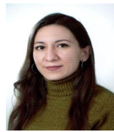
Ameliyathane Sterilizasyon S. Hem / Cansel KURHAN ÜYE